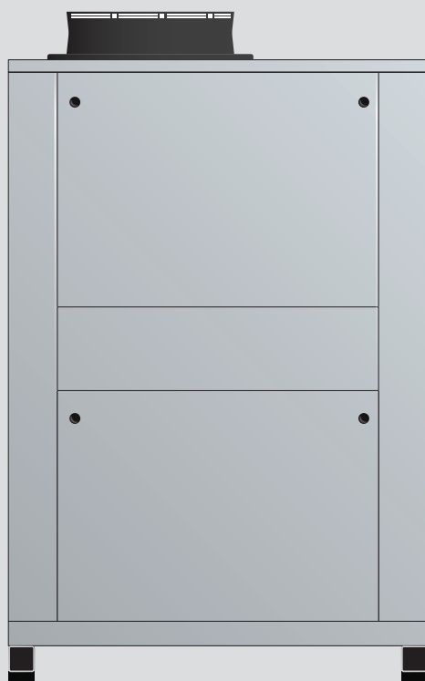
Armoire de commande externe avec panneau de commande